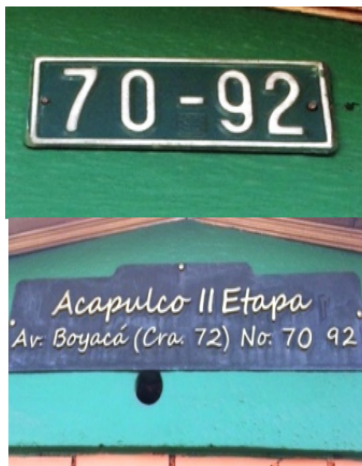
Foto 1.- Sitio de la visita

Radicado - Concepto Técnico o Acto Administrativo: 2020ER07921 del 15 de enero de 2020