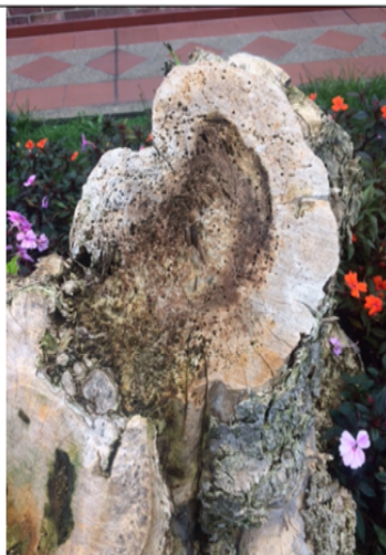
Foto 3.- Se observa el árbol de la especie Sauco ( Sambucus nigra ), talado sin autorización