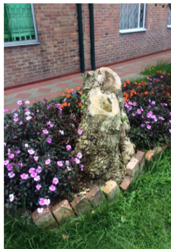
Foto 2.- Se observa el árbol de la especie Sauco (Sambucus nigra), talado sin autorización